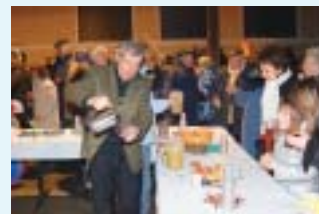
Le 8 décembre 2005.