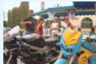
Le forum des associations en septembre 2005.