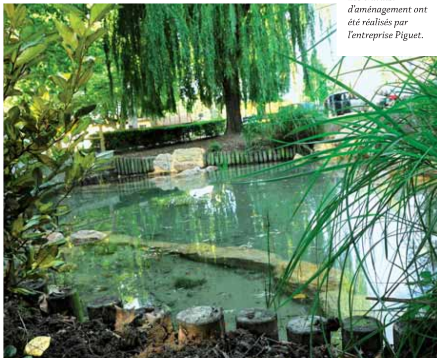
Les travaux d'aménagement ont été réalisés par l'entreprise Piguet.

Pendant la durée des travaux, les poissons ont été déplacés dans un bassin, à proximité du stade. Ils seront réintroduits dès que la pompe sera mise en route. Quant aux canards, un nichoir leur sera spécialement destiné.