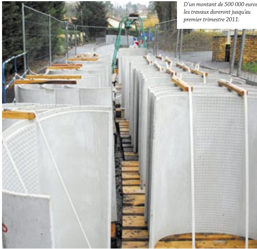
D'un montant de 500 000 euros, les travaux dureront jusqu'au premier trimestre 2011.

De la route des Prolières jusqu'à la mairie, des travaux d'assainissement sont actuellement en cours. L'objectif : dévier les eaux claires des eaux usées.